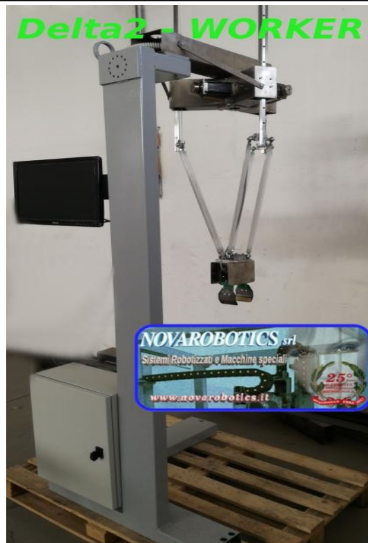
Robot manipolatore serie Delta Novarobotics srl

Progettata per trattare con la massima cura il tuo prodotto.